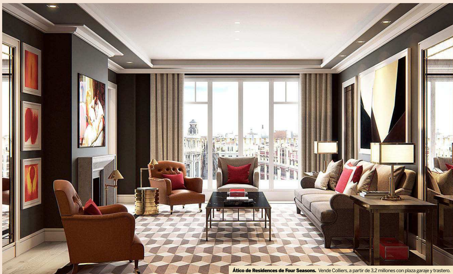
Ático de Residences de Four Seasons. Vende Colliers, a partir de 3,2 millones con plaza garaje y trastero.